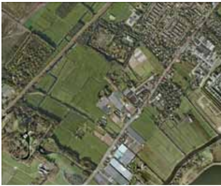
Proefproject Landgoederen Kustgebied: Huidige situatie