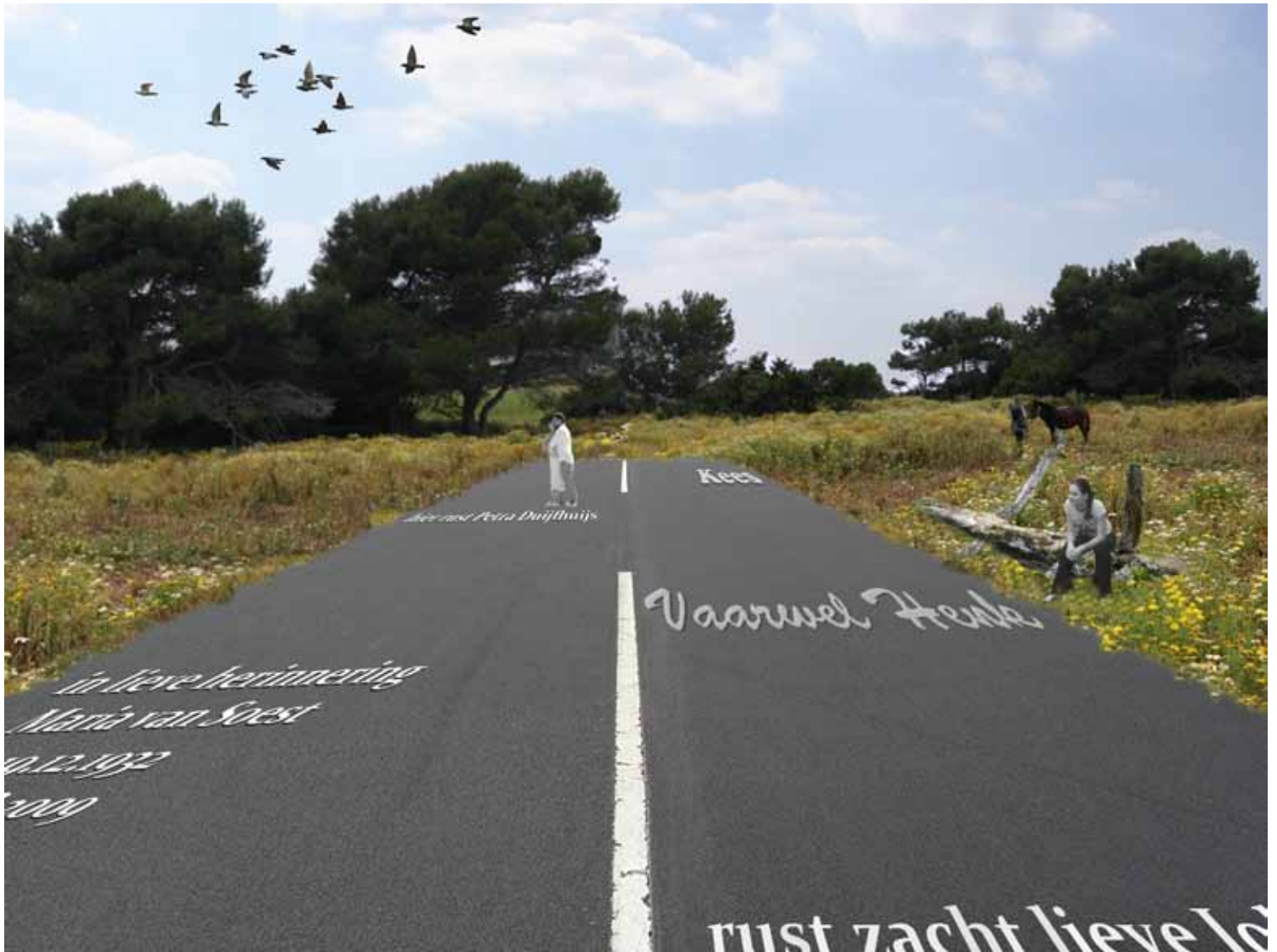
'Laatste saluut op een voormalig militair terrein', een impressie

6. Het verband tussen natuurwaarde en locatiespecifieke uitwerkingen zal nader moeten worden onderzocht in samenspraak met deskundigen op het gebied van ecologie. Dit kan bijvoorbeeld op basis van onze voorbeelduitwerkingen.