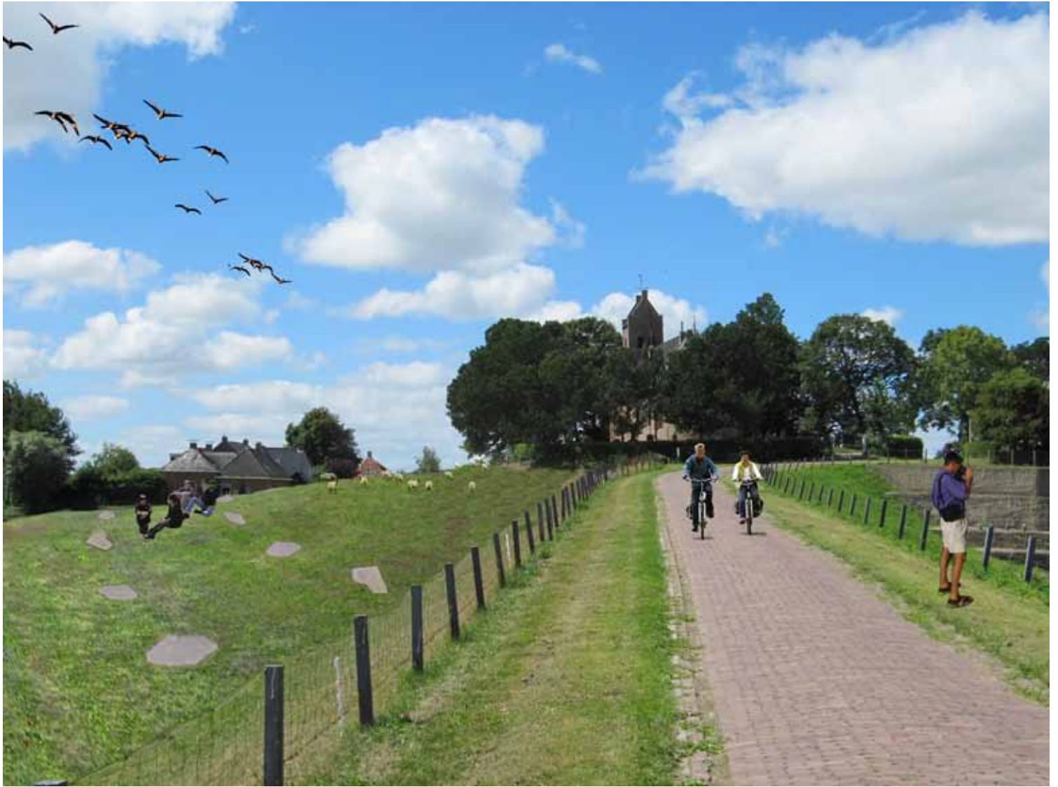
'Herstel van een oude terp', een impressie