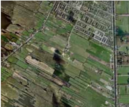
Proefproject Vuilstort Kortenhoef: Huidige situatie