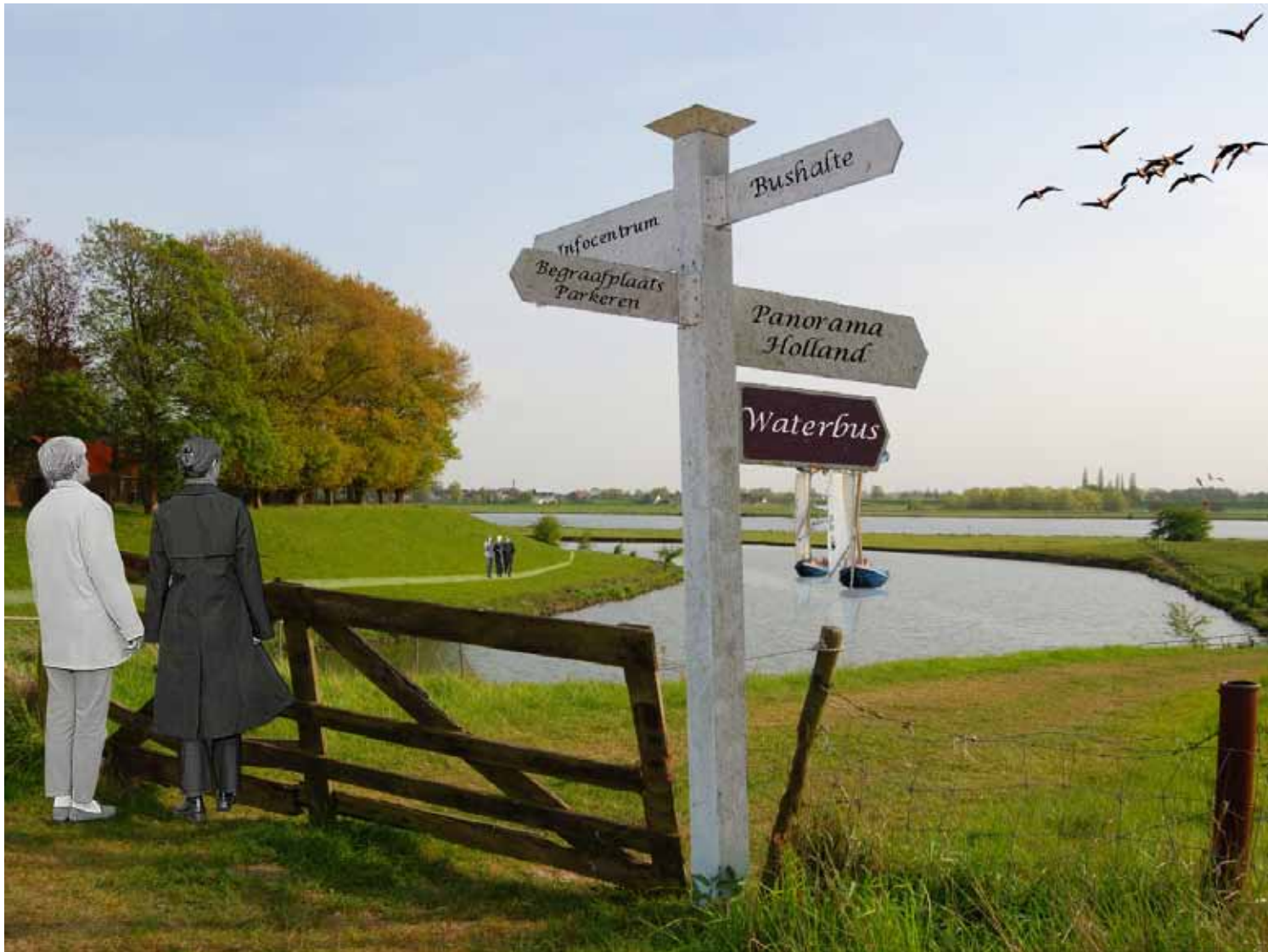
'Een fort als startegische gedenkplaats', een impressie

ontworpen kan op zo'n plek iets prachtigs ontstaan. De voorbeeldplannen zijn nauwkeurig doordacht en uitgewerkt. Ze zijn ontworpen als onderdeel van grotere structuren en verbanden en afgestemd op de bestaande natuurlijke en cultuurhistorische waarden. Het begraven zelf is daarbij niet meer dan een onderdeel van een veel ruimer opgezet plan voor landschapsaanleg of -herstel. De natuurbegraafplaats is opgevat als kostendrager van de integrale aanpak van natuurgebieden of waardevolle landschappen.