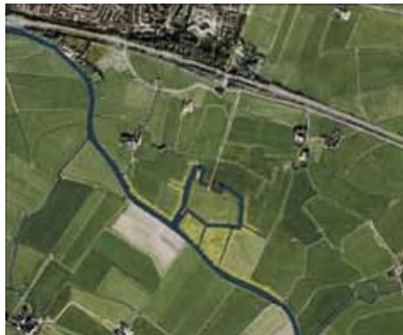
Proefproject Terpen in het Zeekleigebied: Toekomstige situatie