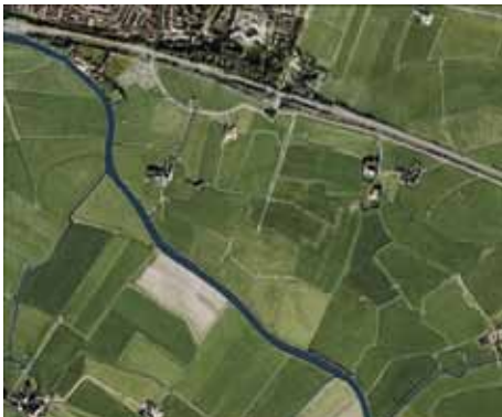
Proefproject Terpen in het Zeekleigebied: Huidige situatie