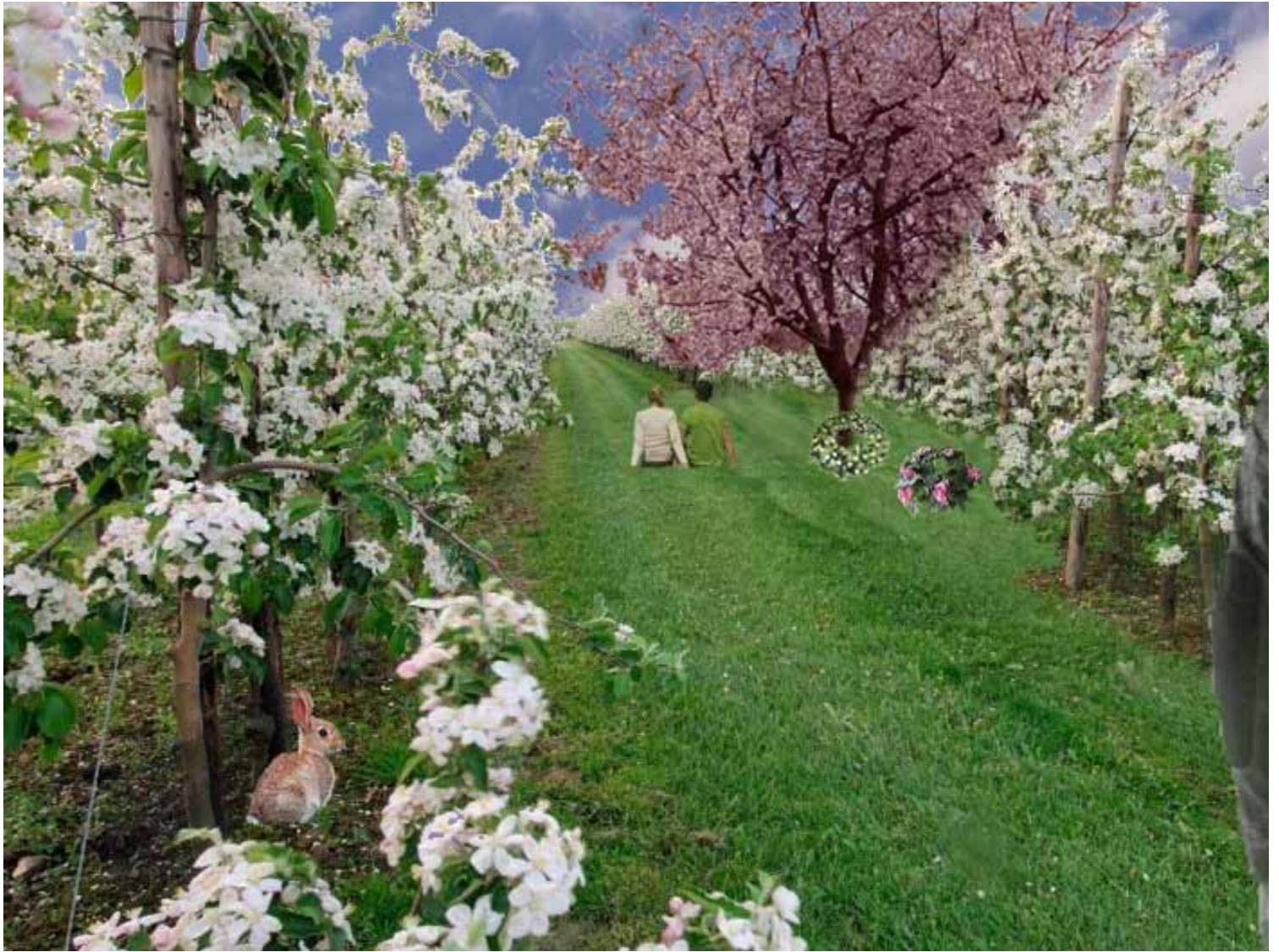
'Boomgaard in de Betuwe', een impressie