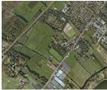
Proefproject Landgoederen Kustgebied: Toekomstige situatie