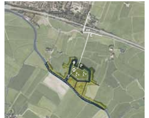
Proefproject Terpen in het Zeekleigebied: Toekomstige functies

landschap als een waardevol cultuurlandschap of een monumentale plek kunnen als gastheer dienst doen. De term natuurbegraafplaats is in die zin misleidend. Je zou beter kunnen spreken van een "landschappelijke begraafplaats".