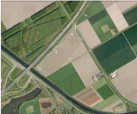
Proefproject Droogmakerij: Huidige situatie