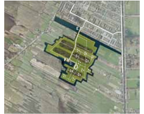
Proefproject Vuilstort Kortenhoef: Toekomstige functies