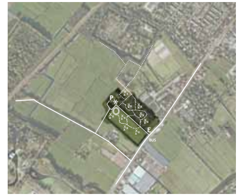
Proefproject Landgoederen Kustgebied: Toekomstige functies