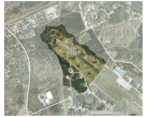
Proefproject Voormalig militair vliegveld: Toekomstige functies