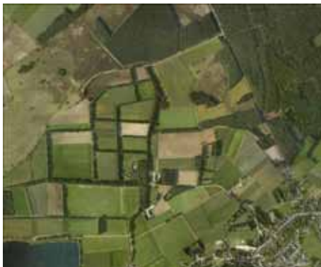
Proefproject Essenlandschap op het zand: Huidige situatie