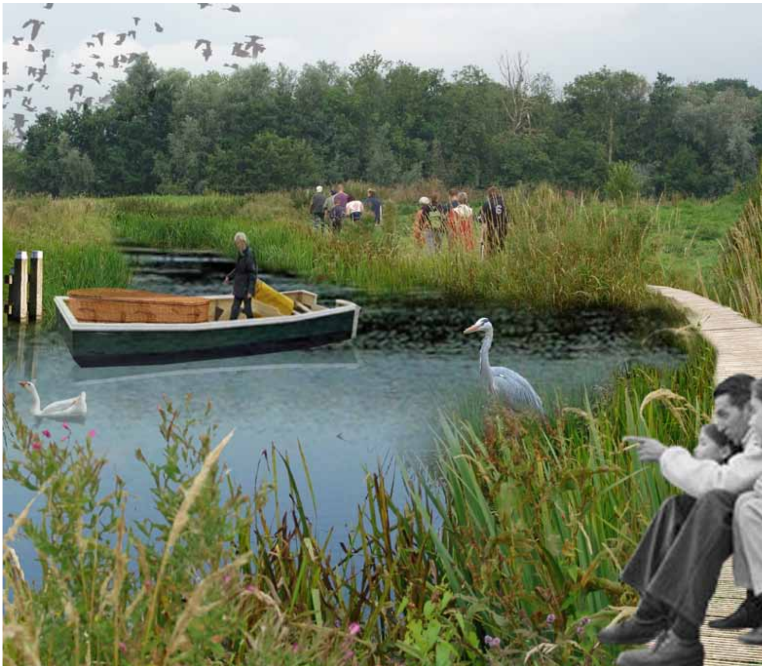
'Varend vaarwel in het veenlandschap', een impressie

De natuurbegraafplaats kan bijdragen aan educatie en een betere ontsluiting van omliggende gebieden door aanleg van paden, aansluiting op doorgaande (recreatieve) routes en dubbel gebruik van parkeervoorzieningen.