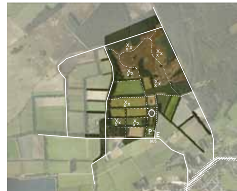
Proefproject Essenlandschap op het zand: Toekomstige functies