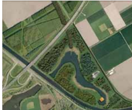
Proefproject Droogmakerij: Toekomstige situatie