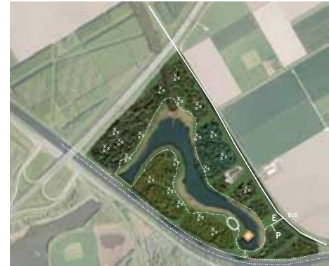
Proefproject Droogmakerij: Toekomstige functies