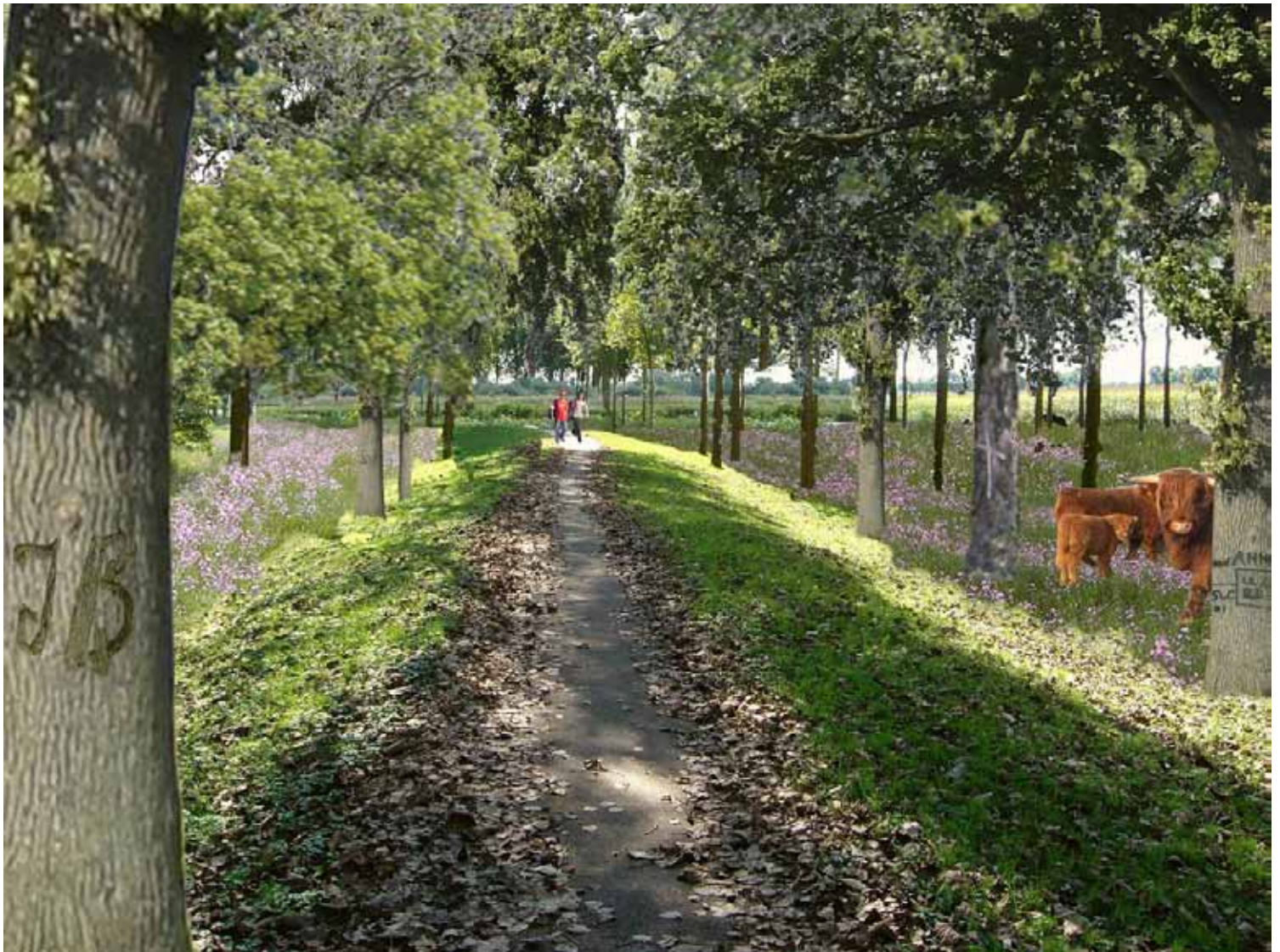
'Memoires op een parklandgoed', een impressie

De opkomst van natuurbegraafplaatsen is een internationaal fenomeen. In Nederland blijft het aanbod vooralsnog achter bij een groeiende maatschappelijke behoefte. Daarbij komt dat door de grijze golf de komende jaren substantieel meer mensen begraven zullen worden. Met natuurbegraafplaatsen kan op een aansprekende, kwalitatieve en duurzame manier aan de vraag worden voldaan.