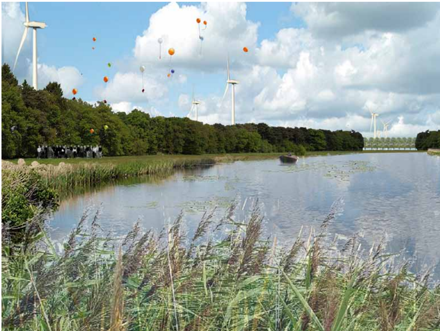
'Van stof tot stof in een droogmakerij', een impressie

In ons rapport komen wij tot de volgende aanbevelingen: