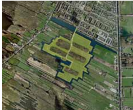
Proefproject Vuilstort Kortenhoef: Toekomstige situatie