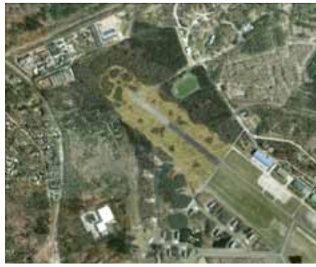
Proefproject Voormalig militair vliegveld: Toekomstige situatie