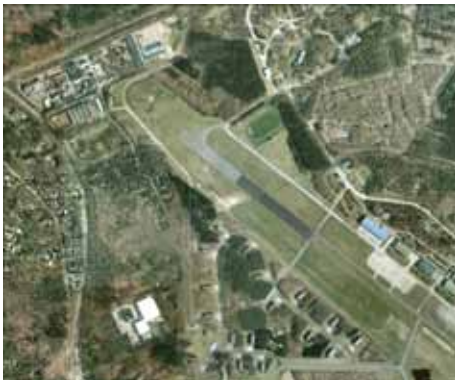
Proefproject Voormalig militair vliegveld: Huidige situatie