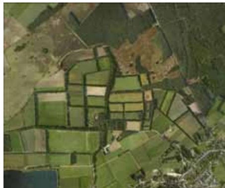
Proefproject Essenlandschap op het zand: Toekomstige situatie